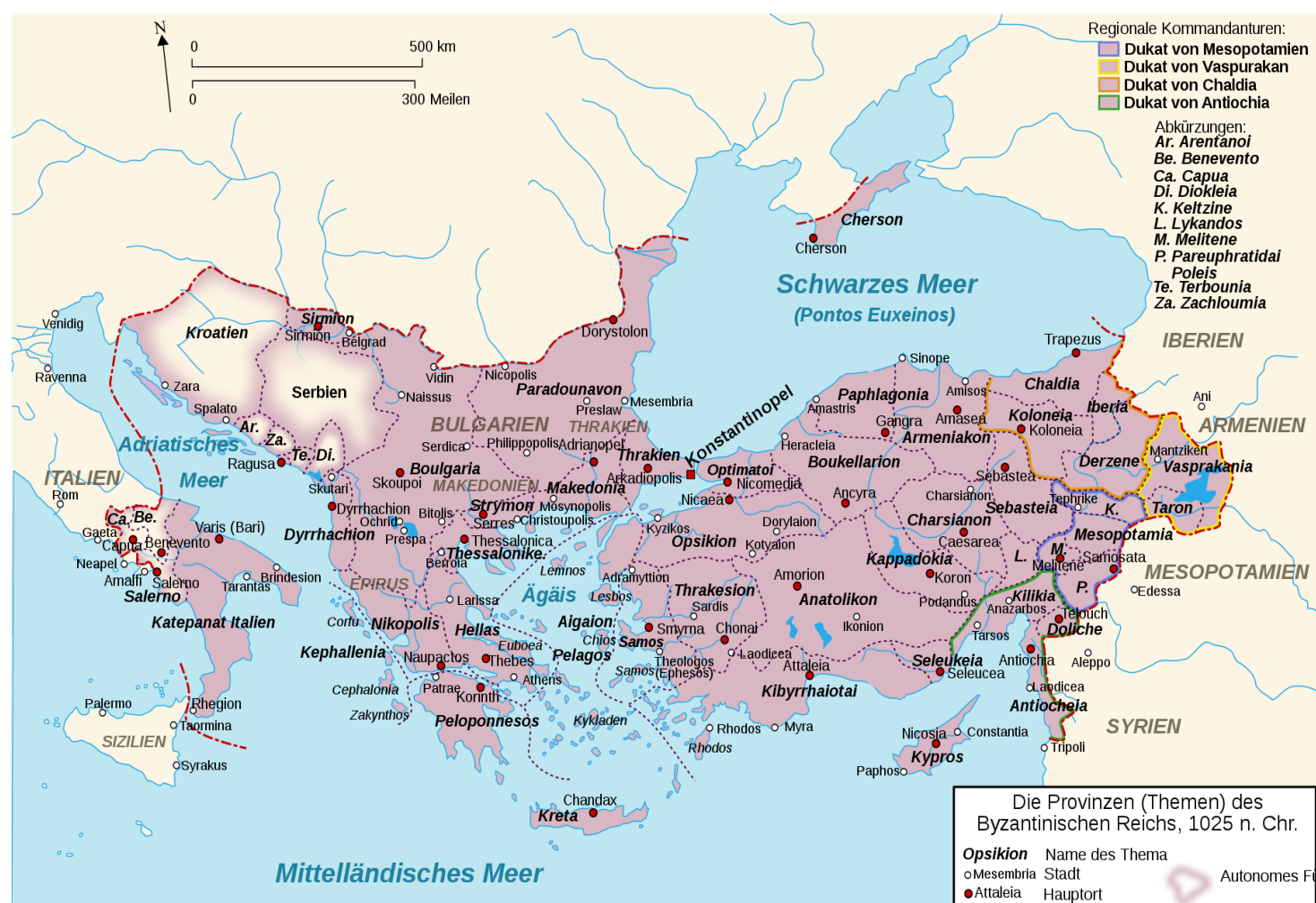
Das Byzantinische Reich um 1081, nach der türkisch-seldschukischen Landnahme Kleinasien, die der byzantinischen Niederlage bei Manzikert 1071 gefolgt war https://de.wikipedia.org/wiki/Byzantinisches_Reich#/media/File:Byzantium1081AD.PNG